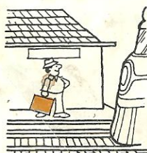
a la estación del tren